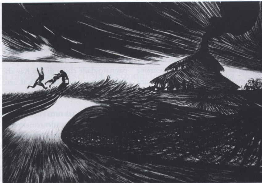
Illustrazione di Lorenzo Mattotti per Hansel e Gretel

di piani di linguaggio e di racconto: c'è il testo che fa da cornice alla vicenda; c'è il racconto di un bambino scritto con grafia incerta e infarcito di errori grammaticali che rendono divertente la lettura; ci sono le illustrazioni che rimandano a una dimensione onirica di quel che il protagonista immagina e non osa sperare accada. La lunghezza del testo ne fa un libro da leggere insieme ad alta voce, sfogliandolo e apprezzandolo in tutte le sue parti ed è - credo - il prodotto migliore che sfata i pregiudizi che ancora si riscontrano verso l'illustrazione proposta ai più grandi nei percorsi narrativi.